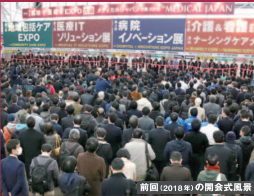
前回(2018年)の開会式風景

参加 歓迎 開会式 初日 9:30~ 2/20(水) 介護・医療分野のトップなど40名が参列!