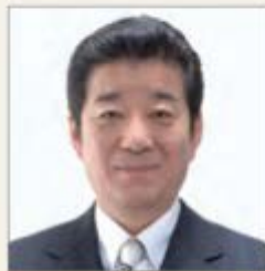
関西広域連合 広域産業振興担当委員 大阪府知事 松井 一郎

医療の総合展「メディカル ジャパン」が、関西で開催されますことを心より歓迎申し上げます。